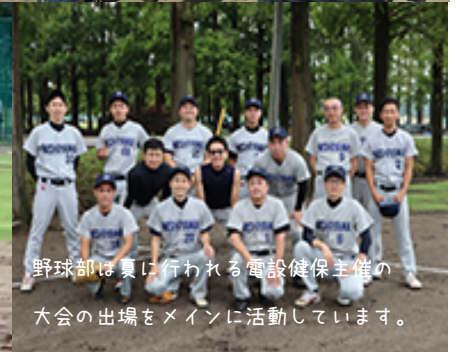
野球部は夏に行われる電設健保主催の大会の出場をメインに活動しています。