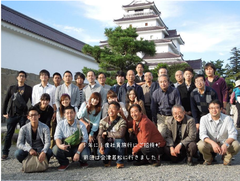
5年に1度社員旅行にご招待♪ 前は会津若松に行きました！

西山電気では、社員旅行、部活・同好会他社員同士の交流などにより、社員同士の結束を強めること、余暇時間の充実により社員のリフレッシュの機会を設けています。