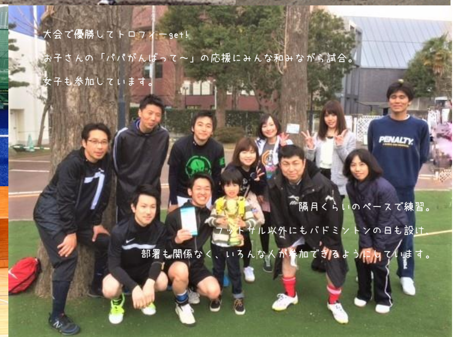
大会で優勝してトロフィーget! お子さんの「パパがんばって〜」の応援にみんな和みながら試合。 女子も参加しています。